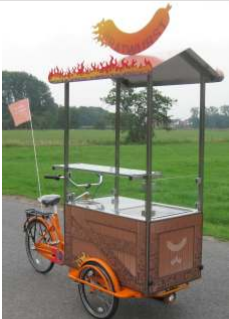
Abb: Modell Tupelo 0.1 mit Spitzdach

Sie können unsere Standadmodelle auf Ihre individuellen Wünsche zuschneiden lassen