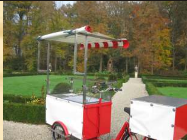
Abb: 3.0 Abb:Tupelo 0.2

Dies ist besonders sinnvoll wenn der Standplatz öfter gewechselt werden muss.