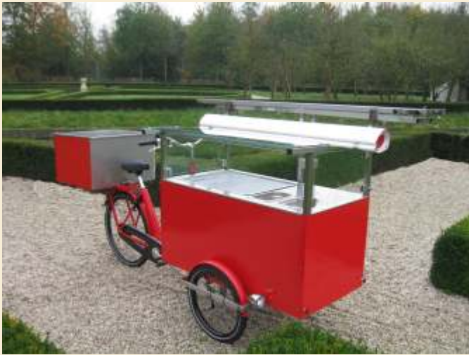
Abb: Modell Tupelo 0.2 mit volldach